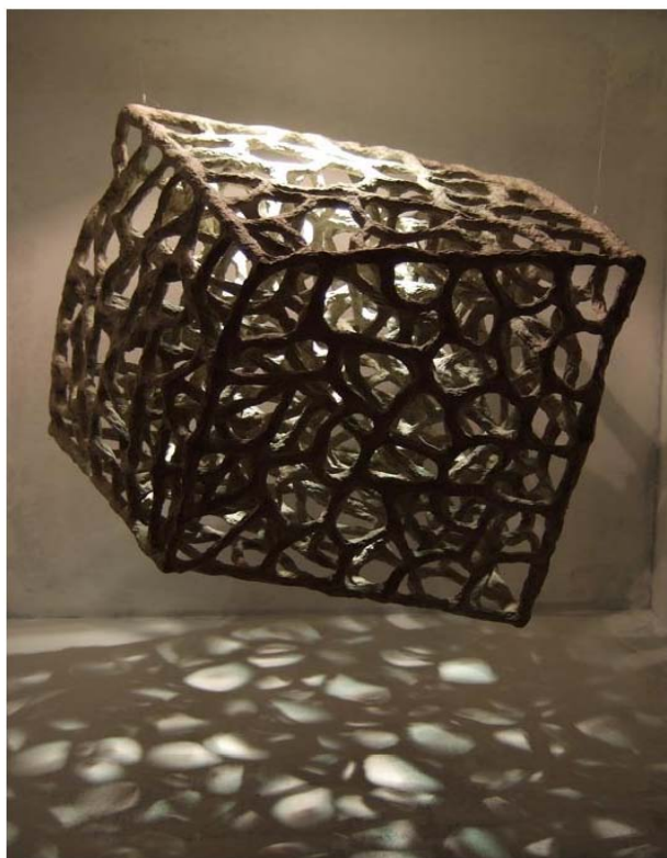
Fragment cubique – 2007 – papier - 26 x 26 x 26 cm

(Extrait d'un article paru dans le magazine «Ateliers d'Art» de septembre/octobre 2007)