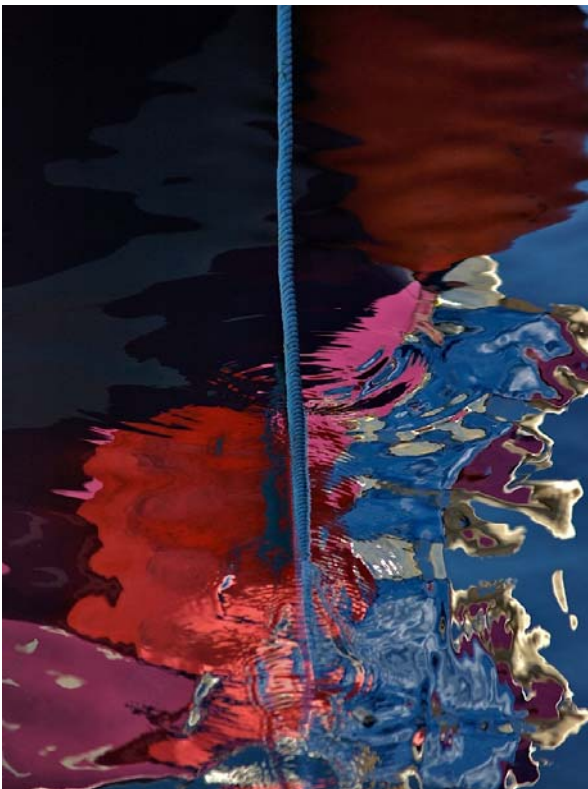
Réflexion 4 - 2008 - diasec - 120 x 90 cm

Eric Atlan est né en 1958. Après des études de photographie à Paris, il travaille plusieurs années dans le domaine de l'illustration, de la mode, de la photo en studio. Sa formation au CREAR, école de cinéma, lui ouvre ensuite le monde de la réalisation de fictions et de films documentaires. Il collabore ainsi à la création d'œuvres audiovisuelles pour de grandes chaînes nationales. Depuis quelques années, avec l'émergence de la technologie numérique, il revient à sa passion première, la photographie, qui n'a jamais cessé de l'accompagner.