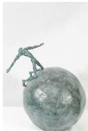
Liberté bronze 1/8