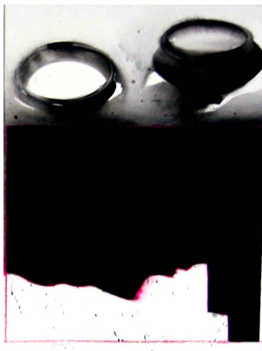
Magma 181 - 2008 - diptyque - Pigments et acrylique sur toile - 130 x 94 cm / 130 x 97 cm