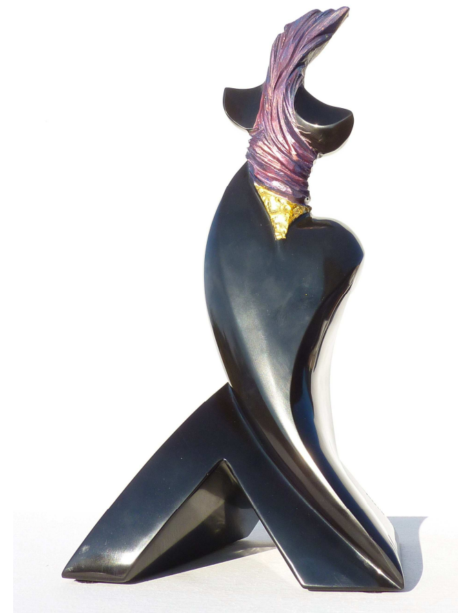
TRIANGLE D'OR. Marbre, or fin

Juin 2010 : Membre du jury, corrections d'examens au L.E.P 'la Roquette' de Coutances.