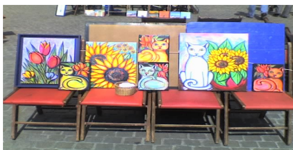
Les Belles Chaises, Nantes, le 17 mai 2008

En 1997, je m'installe en dehors de l'hexagone, car mes activités professionnelles m'appellent vers d'autres espaces. J'ai la chance de vivre en Autriche et de sillonner l'Europe Centrale. C'est là que je m'inspire amplement de l'art populaire et surtout l'art naïf floral et animalier, qui orne l'architecture, le mobilier et l'artisanat typique de ces régions.