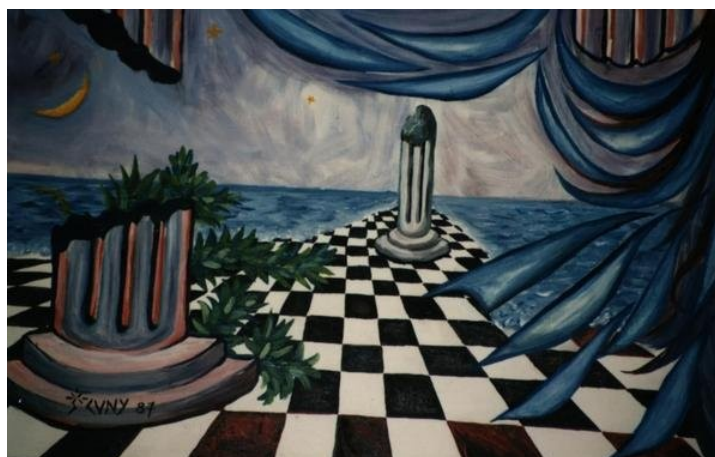
Les colonnades, huile sur toile (1987)