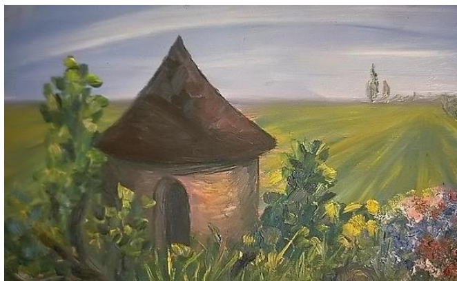
Campagne Huile sur toile

Depuis tout petit je me passionne pour le tissus et le dessin car faute d'utiliser mes jambes pour marcher, je suis habile de mes mains et ne manque pas d'imagination.