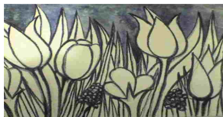
Printemps, lavis sur plaque de bois compressée