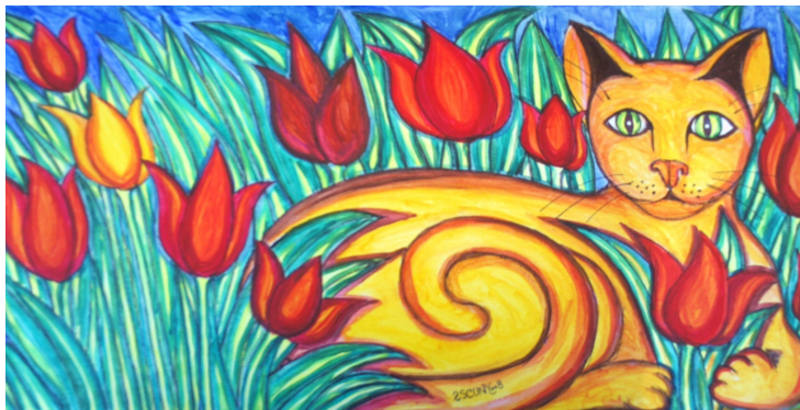
Chat à la Platebande II (2008) - Acrylique sur toile

Depuis 1979, je ne cesse de peindre, soit depuis l'âge de 22 ans. Je suis tout d'abord inspiré par l'impressionnisme et me dirige ensuite vers la peinture surréaliste. C'est alors qu'une évolution professionnelle me permet de venir m'installer à Nantes en 1987 et je participe pour une dernière fois au salon des Indépendants en 1988, les Colonnades.